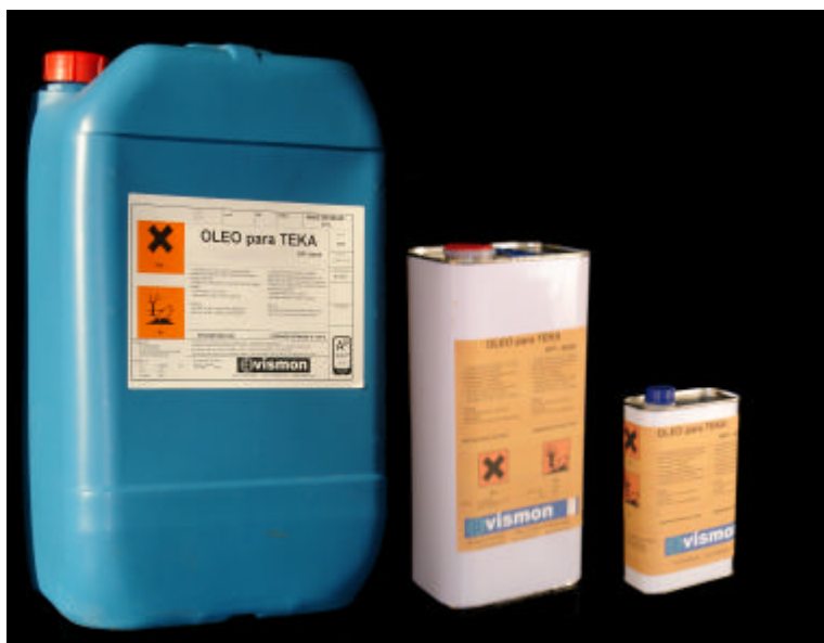
Embalagem 25 litros, 5 litros, 1 litro

O tratamento de madeiras nobres ou tropicais requer precisamente por sua nobreza e custo, produtos altamente especializados que proporcionem à madeira uma grande proteção sem alterar o belo aspecto que de por se mesmas estas madeiras têm.