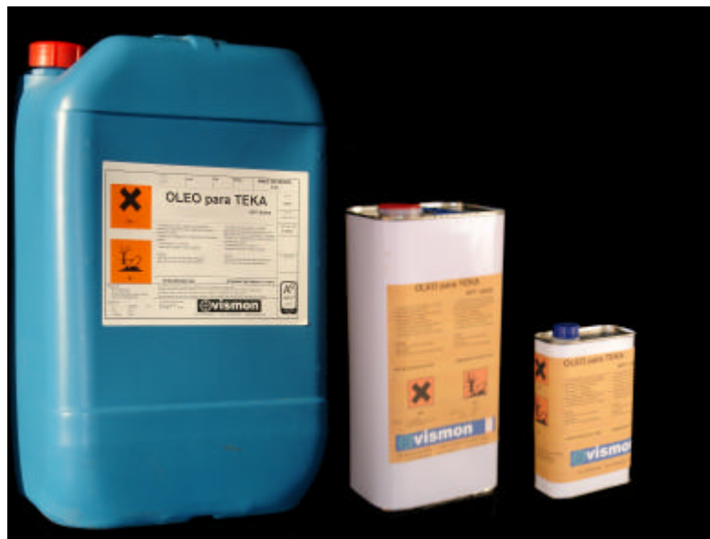
Embalaje 25 litros, 5 litros, 1 litro

El tratamiento de maderas nobles o tropicales requiere precisamente por su nobleza y coste, productos altamente especializados que proporcionen a la madera una gran protección sin alterar el bello aspecto que de por sí mismas estas maderas tienen.